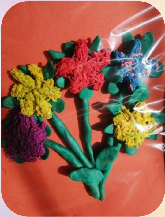
Цветы из тертого пластилина

Контурная пластилинография – это изображение рисунка по контуру, с использованием «жгутиков» (колбасок), тертого пластилина, «налепов» по рисунку и т.д.