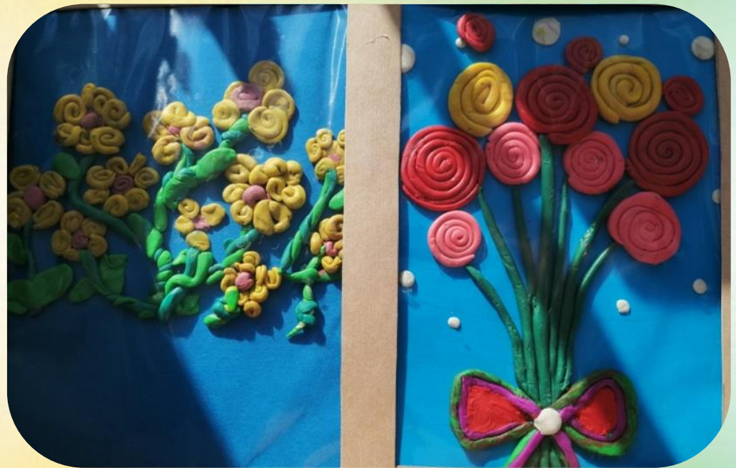
Цветы, выполненные с использованием «жгутиков» (колбасок)